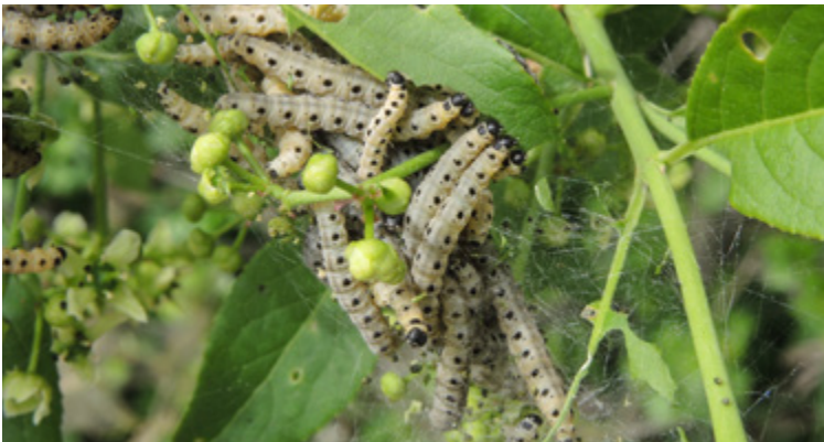
Gesellig im Gespinst auftretende Raupen von Yponomeuta sp.