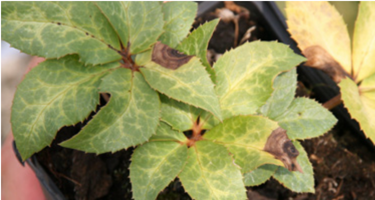
Erste Blattsymptome an Christrose durch Coniothyrium hellebori