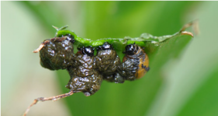
Vier von Kot bedeckte Larven von Lilioceris lili an einem Lilienblatt