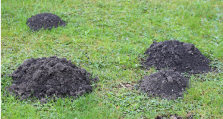
Von einem Maulwurf ( Talpa europaea ) aufgeworfene Erdhügel