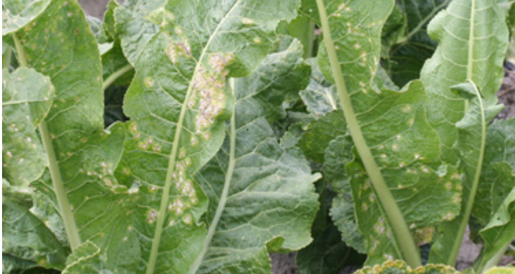
Rostähnliche Blattsymptome an Meerrettich durch Albugo candida