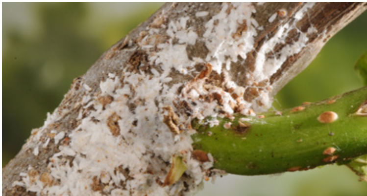
Großflächig vorhandene Schilder (Männchen) von Pseudaulacaspis pentagona