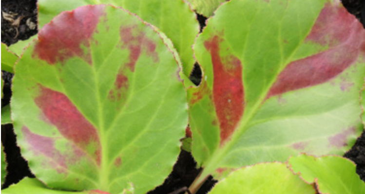
An Bergenien durch Aphelenchoides ritzemabosi verursachte eckige Blattflecken