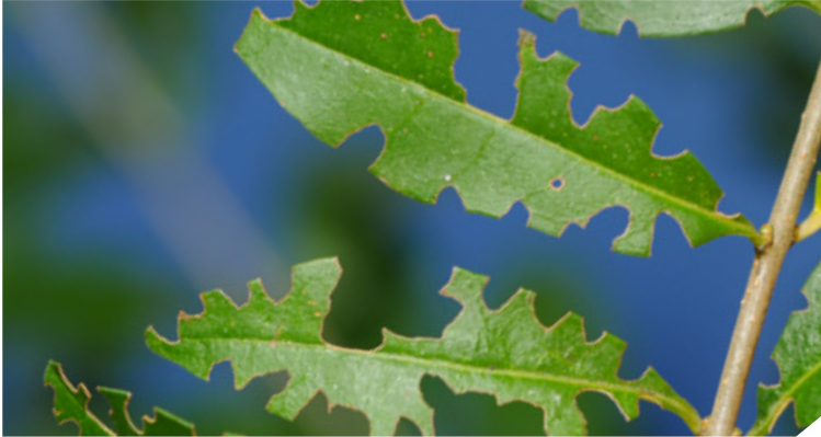
Fraßbild des Käfers von Otiorhynchus sulcatus an Liguster