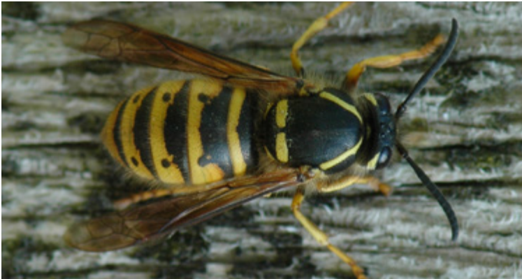
Gemeine Wespe ( Vespa vulgaris ) mit deutlich erkennbar längsgefalteten Flügeln