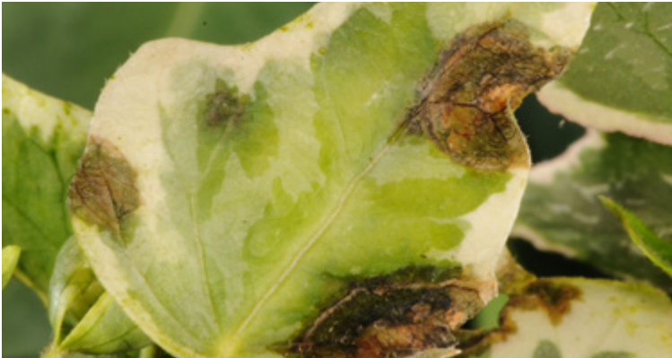
Wässrig-schwarze Blattflecken durch Xanthomonas campestris pv. hederae