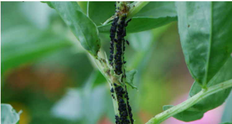
Bereits aus der Distanz sind die Kolonien von Aphis fabae gut erkennbar