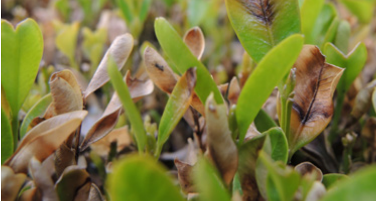
Laub- und Triebbefall durch Cylindrocladium buxicola an Buchsbaum