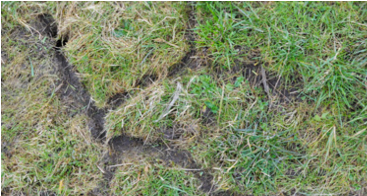
Oberirdische Laufgänge von Microtus arvalis in einer Wiese