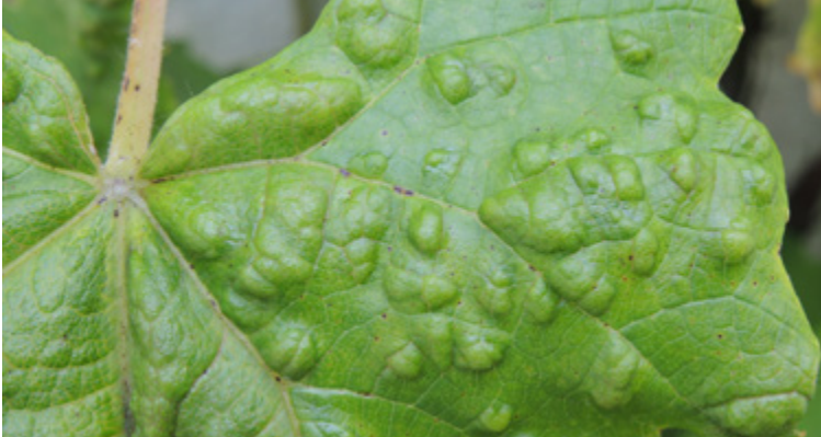
Namensgebende Pockenbildung auf der Blattoberseite durch Eriophyes vitis