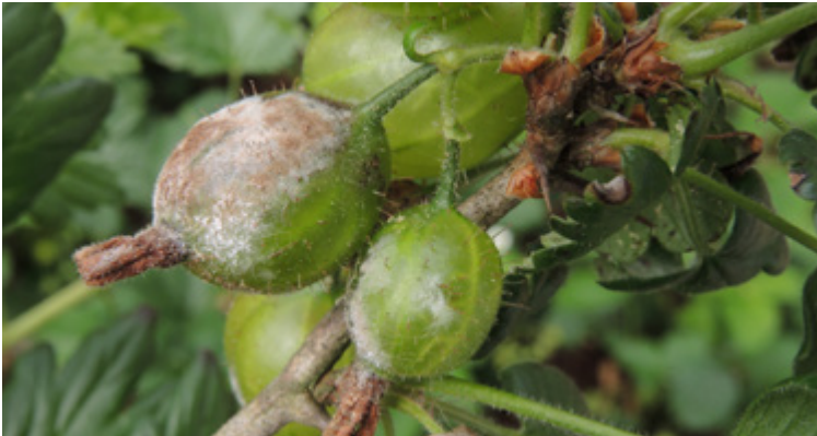
Pilzbelag von Sphaerotheca mors-uvae an den Stachelbeerfrüchten