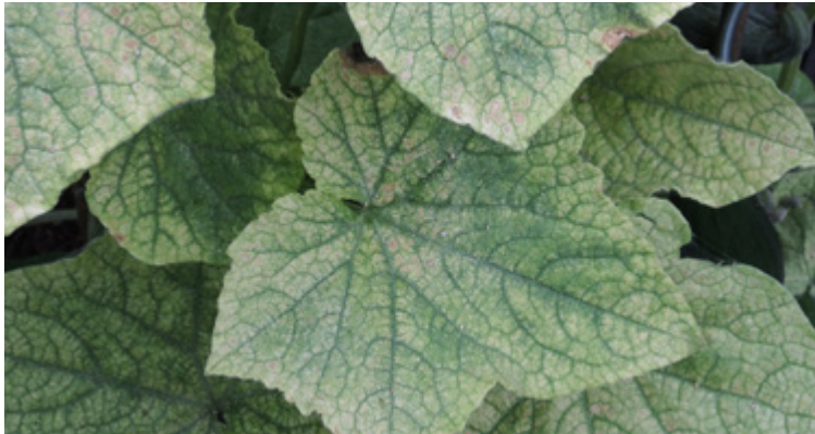
Deutliche Blattsprenkelungen durch Tetranychus urticae an Gurke