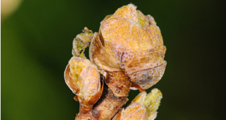
Auffällige Rundknospen, verursacht durch Cecidophyopsis ribis