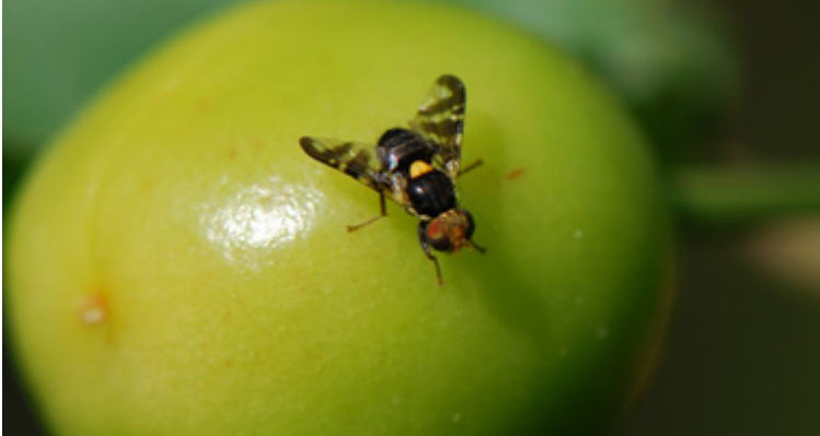
Imago von Rhagoletis cerasi bei der Prüfung einer Kirsche zur Eiablage