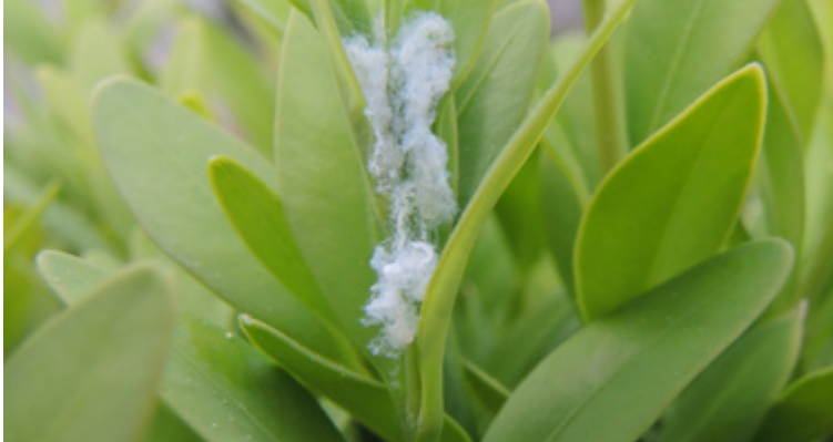
Auffällige, weiß gefärbte Wachswolle durch die Larven von Psylla buxi