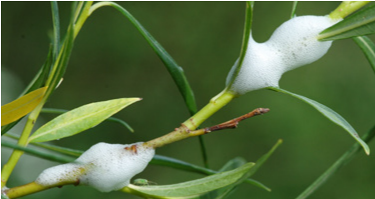
Auffällige Schaumbildungen von Aphrophora salicina an einem Weidentrieb