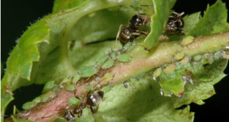
Blattlauskolonie mit Ameisenbesuch zur Aufnahme von Honigtau