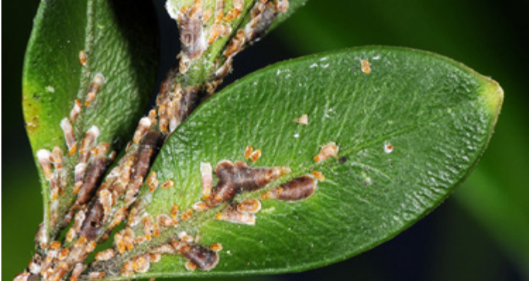
Miesmuschel- bis kommaartige Schilder von Lepidosaphes ulmi an Buchs