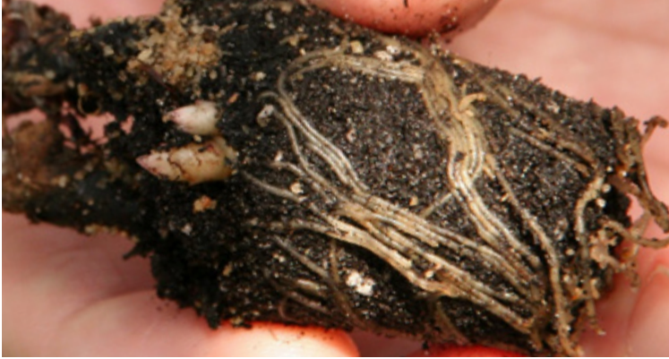
Verbräunte Wurzeln durch eine Infektion mit Thielaviopsis basicola