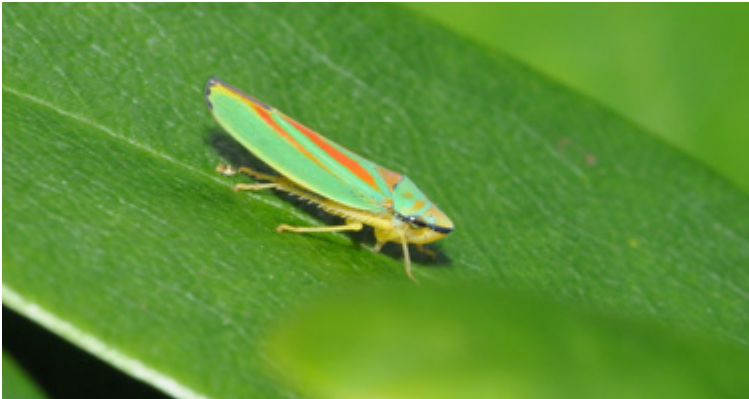
Einzelnes Imago von Graphocephala coccinea auf einem Rhododendronblatt