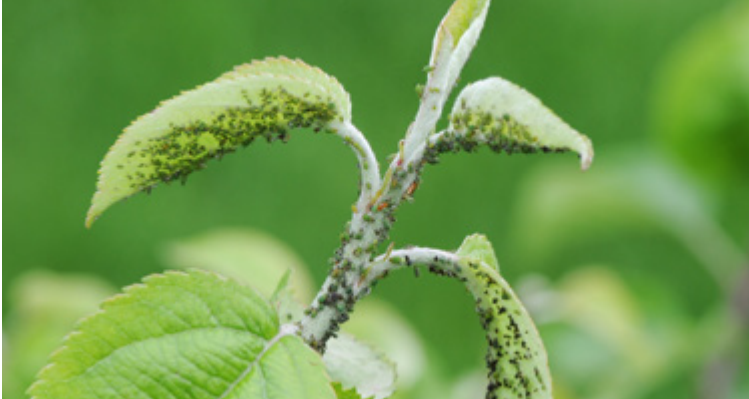
Kolonien von Aphis pomi an einem jungen Apfeltrieb