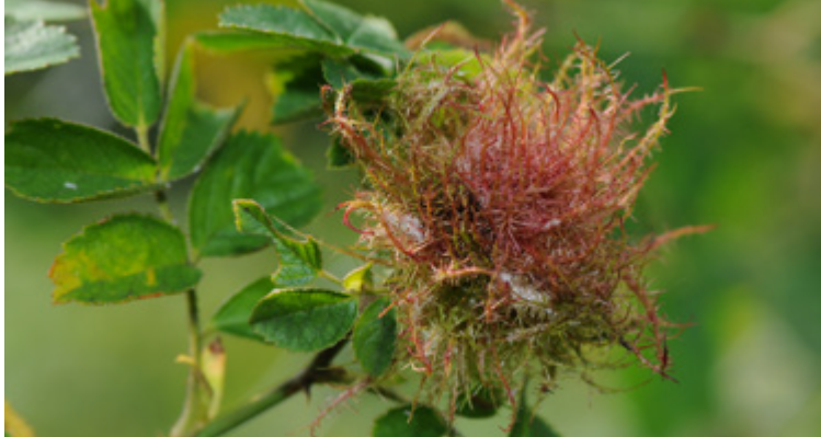
Haarige Galle an einem Rosentrieb, verursacht durch Diplolepis rosae