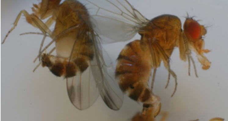
Männchen (links) und Weibchen (rechts) von Drosophila suzukii