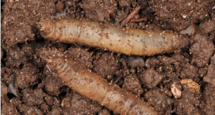
Einzelne Schnaken-Larven ( Tipula sp.); das Hinterende befindet sich jeweils links