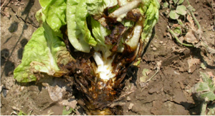
Braunschwarz verfärbte Salatblätter, verursacht durch Rhizoctonia solani