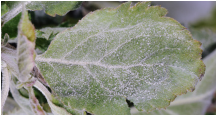
Mehlig-weißer Pilzbelag an einem Apfelblatt durch Podosphaera leucotricha