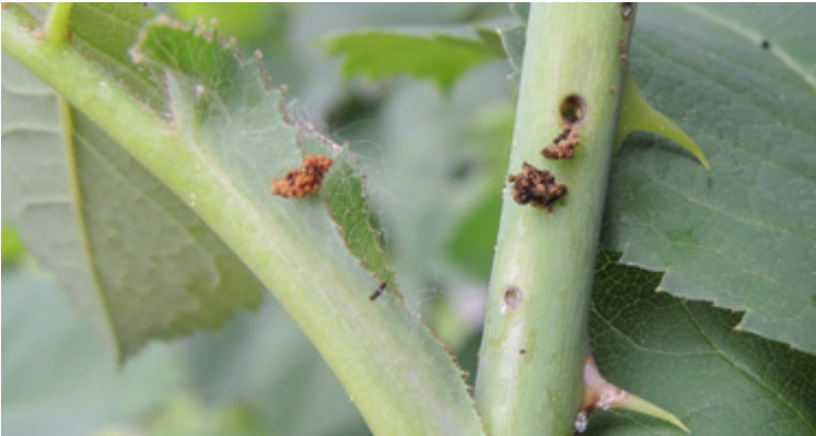
Kotauswurf der im Triebinnern minierenden Larven von Blennocampa elongatula