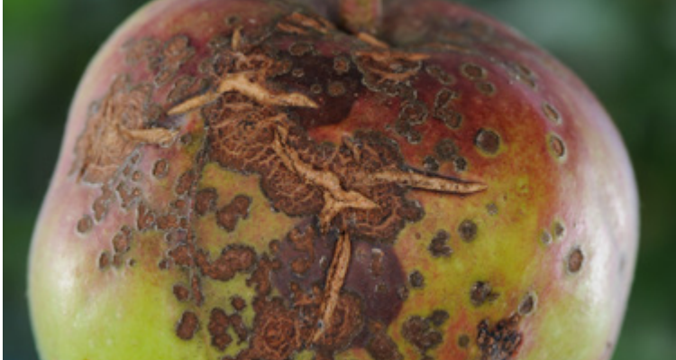
Schorfige Rissbildung durch Venturia inaequalis auf einer Apfelfrucht