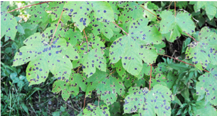
Namensgebende dunkle Blattflecken an Ahorn durch Rhytisma acerinum