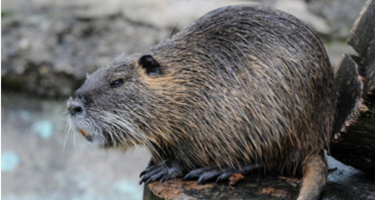
Einzelnes Tier von Myocastor coypus auf einem Baumstamm sitzend