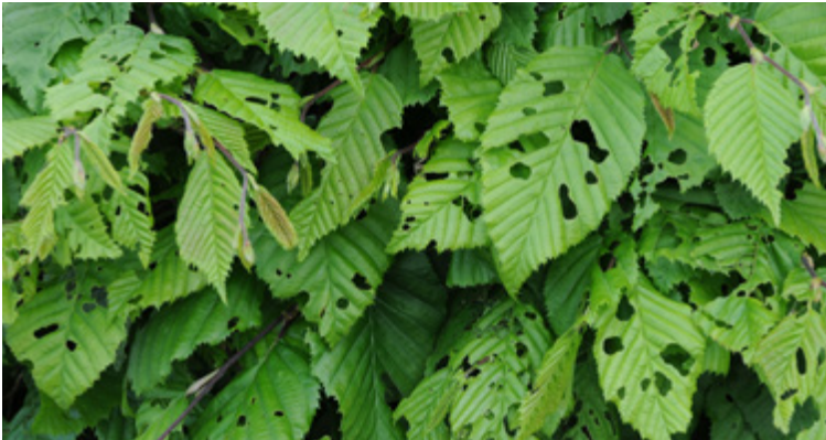
Deutlicher Fraßschaden durch Operophtera brumata an einer Hainbuchenhecke