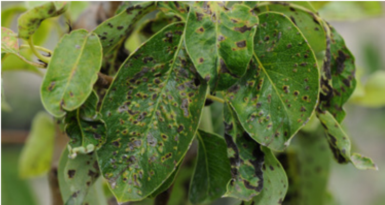
Zahlreiche dunkle, pustelartige flache Gallen, verursacht durch Eriophyes pyri