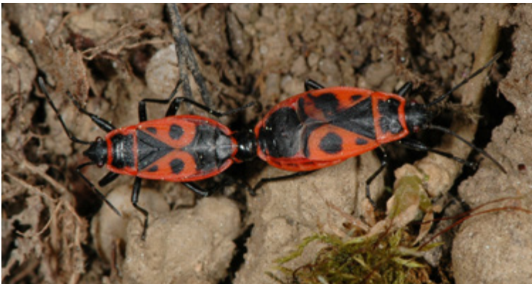
Paarung von zwei Imagines von Feuerwanzen ( Pyrrhocoris apterus )