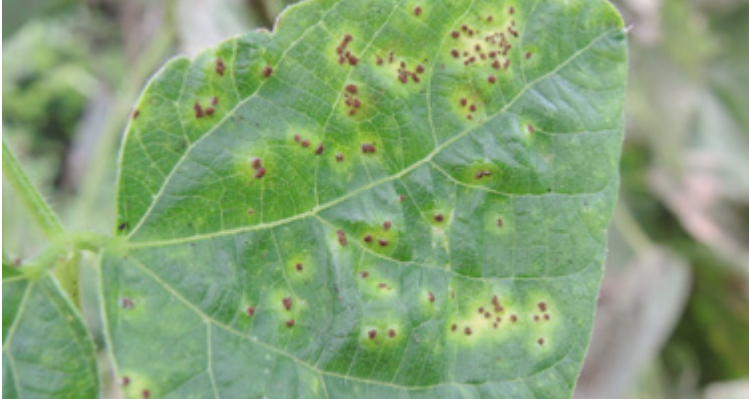
Erste Blattsymptome an Stangenbohne durch Uromyces appendiculatus