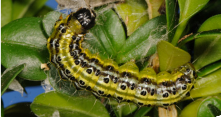
Ältere Raupe von Cydalima perspectalis mit charakteristischem Farbmuster