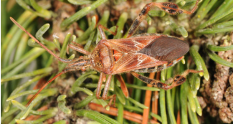
Einzelnes Imago von Leptoglossus occidentalis an einem Kiefernzweig