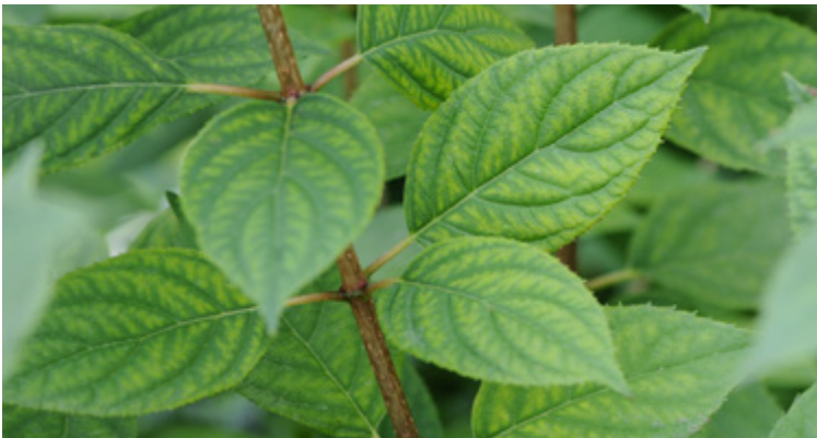
„Fischgrätenmuster“ an einem Hortensienblatt durch Mg-Mangel