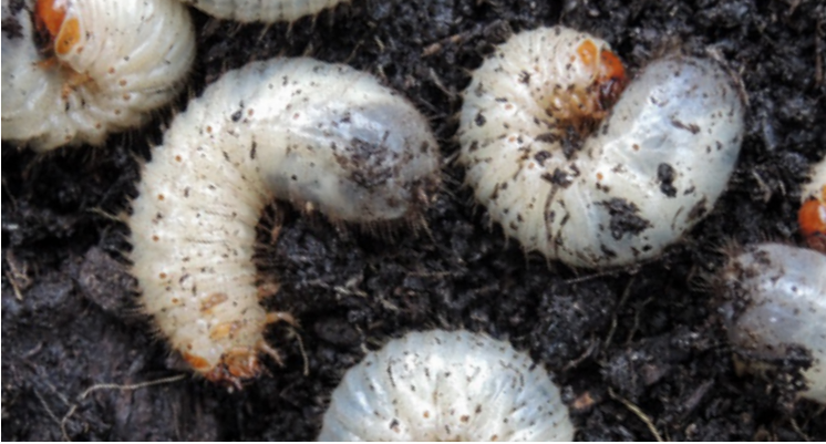
Die Larven von Cetonia aurata finden sich häufiger im Kompost