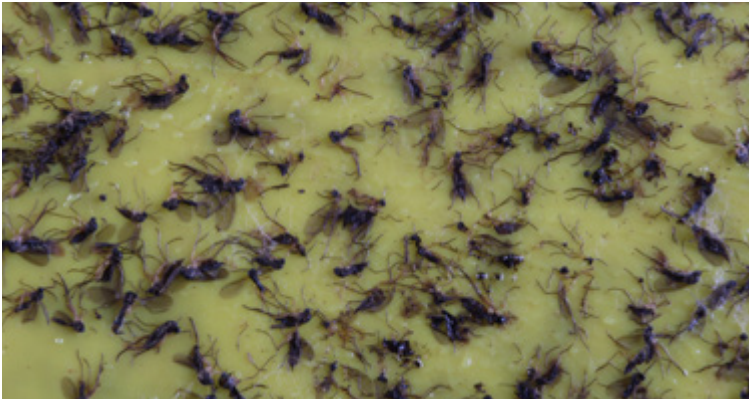
Imagines von Trauermücken ( Bradysia sp.) mit Beifängen auf einer Gelbtafel