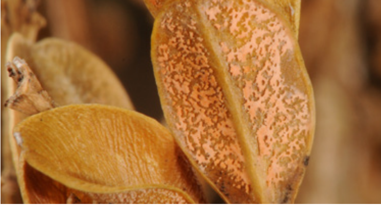
Blattunterseite mit zahlreichen rosafarbenen Fruchtkörpern von Volutella buxi