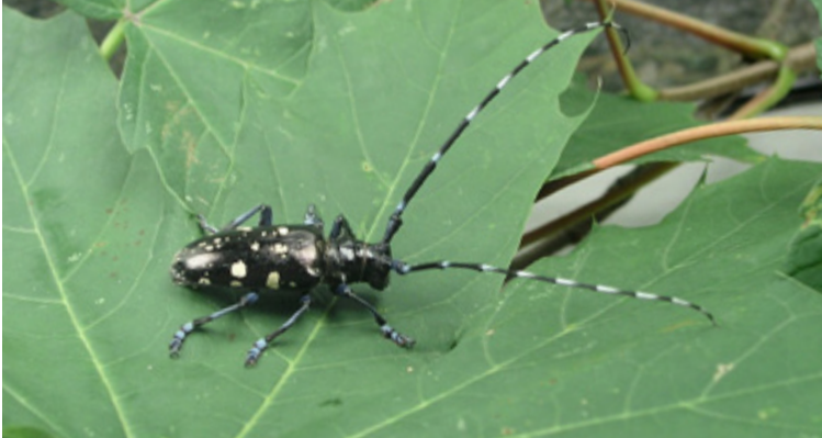
Einzelnes Männchen von Anoplophora glabripennis auf einem Ahornblatt