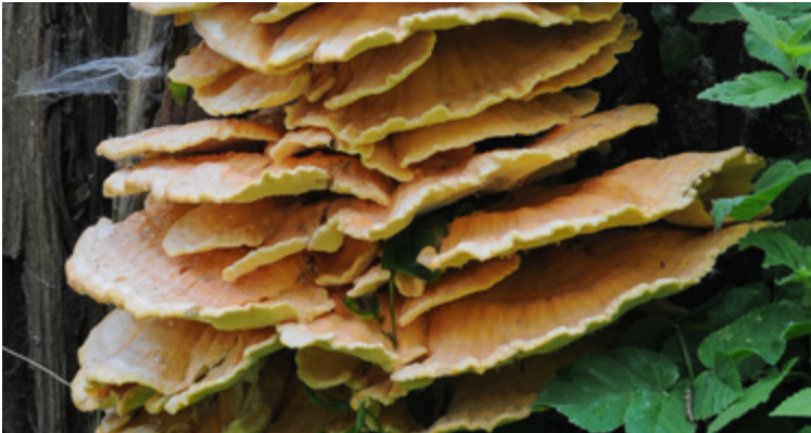
Fruchtkörper von Laetiporus sulphureus an einem Stamm