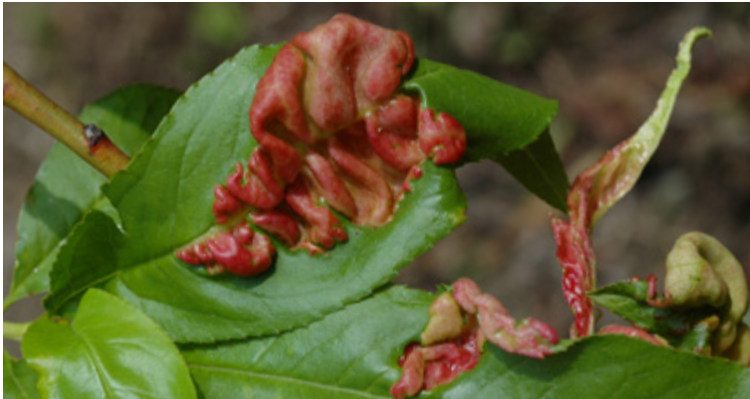
Auffällige Blattdeformationen, verursacht durch Taphrina deformans