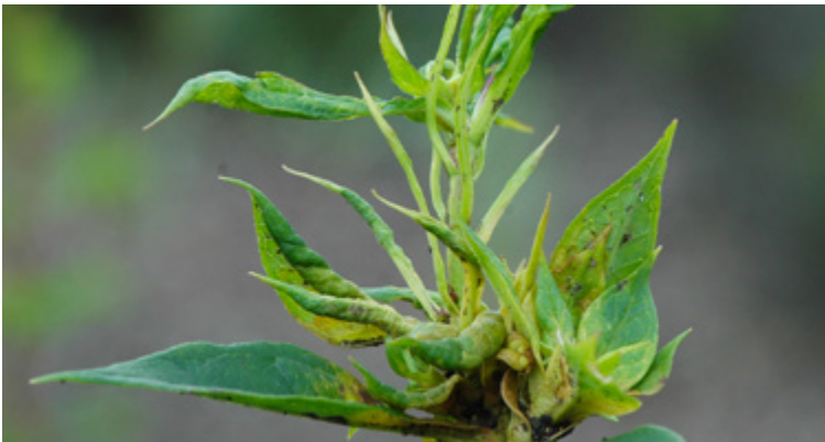
Deutliche Triebdeformationen durch Ditylenchus dipsaci an Phlox