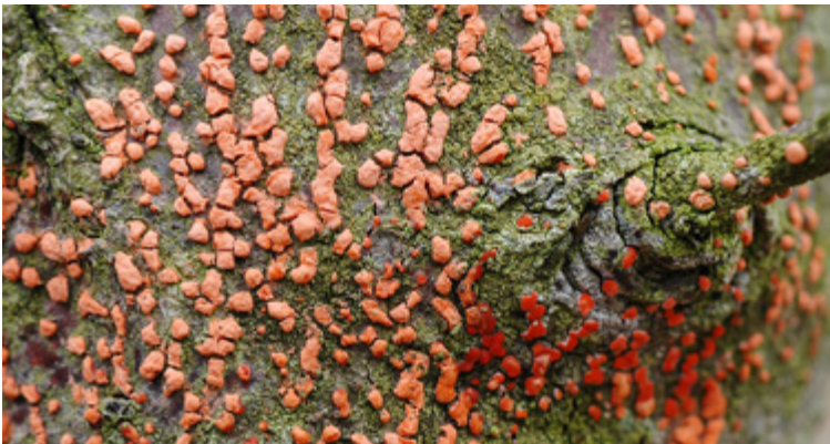
Polsterartige Fruchtkörper (Sporodochien) von Nectria cinnabarina