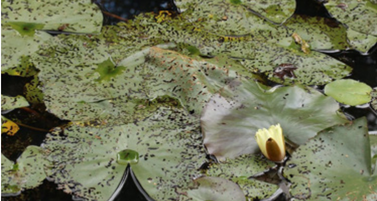
Deutliche Fraßschäden durch Galerucella nymphaea an den Blättern der Seerose