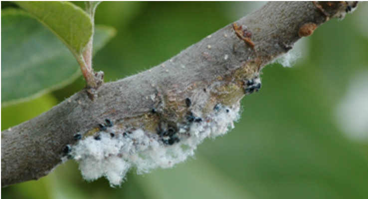
Wachswollartige Kolonien von Eriosoma lanigerum , teils auch parasitiert