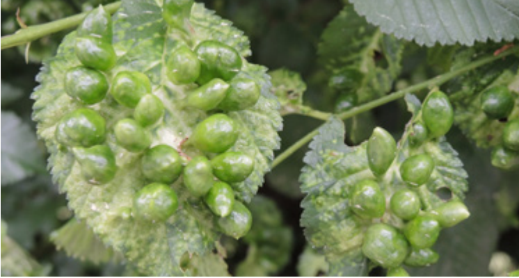
Auffällige Gallenbildung durch Tetaneura ulmi an einem Ulmenblatt