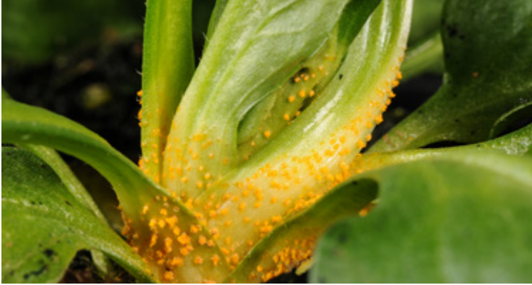
Aecidienlager an Bellis durch Puccinia lagenophorae (Synonym: Puccinia distincta )