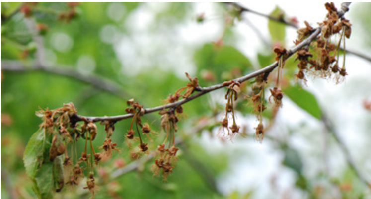
Abgestorbene Blüten mit „Spitzendürre“, verursacht durch Monilia laxa