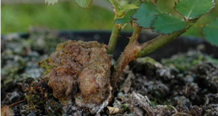
Tumorbildung am Wurzelhals durch Agrobacterium tumefaciens