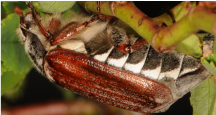
Imago des Feldmaikäfers Melolontha melolontha