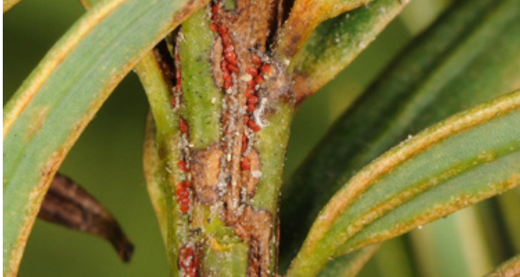
Gesellig an der Nadelbasis von Eiben sitzende Tiere von Pentamerismus taxi