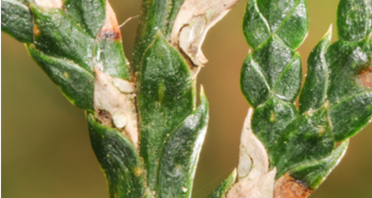
Einzel verbräunte Schuppenblätter durch Didymascella thuja