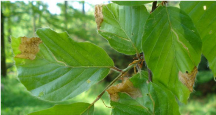
Miniergänge und Platzminen der Larven von Rhynchaenus fagi