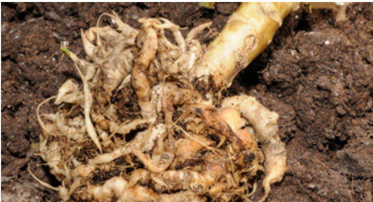
Tumorartige Wurzeldeformationen durch Plasmodiophora brassicae