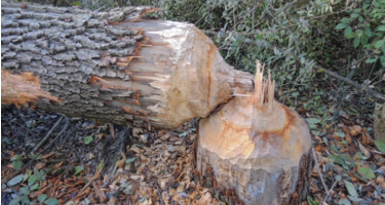
Ein vom Biber, Castor fiber , gefällter Baum mit einem sanduhrartigen Fraßbild