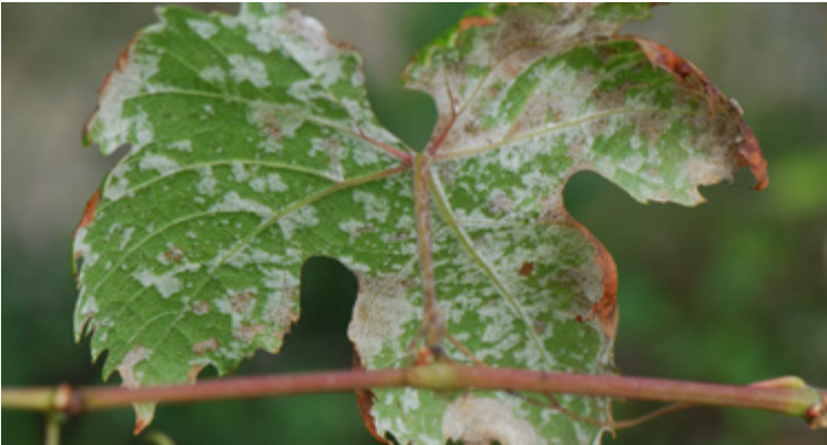
Blattunterseits auftretender, weißlicher Pilzrasen von Plasmopara viticola