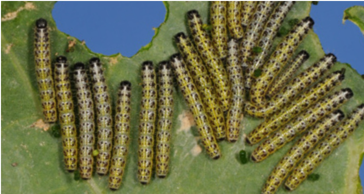
Geselliges Auftreten der Raupen von Pieris brassicae auf einem Kohlblatt