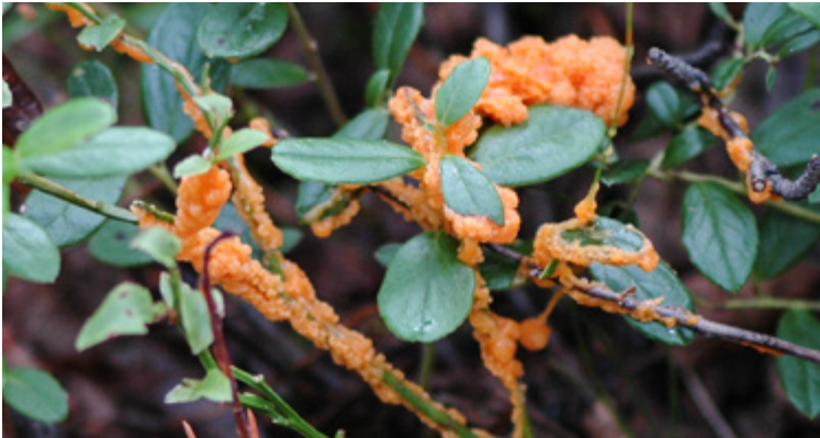
Auffällige Schleimpilzstrukturen (Plasmodium) auf einem Blatt