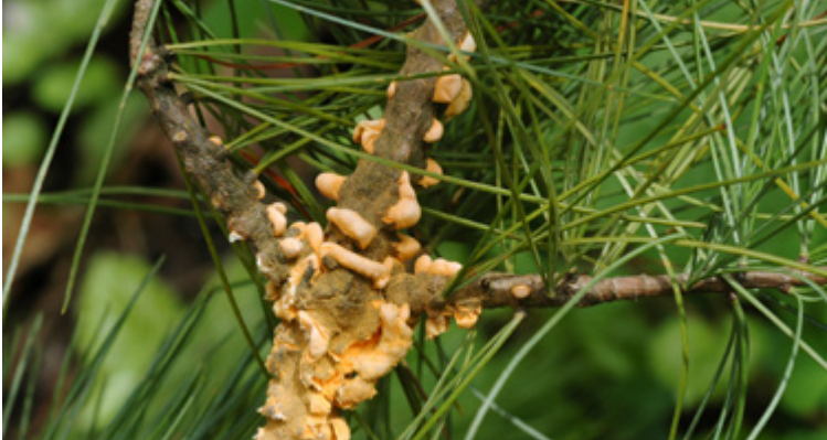
Blasenförmige Sporenlager (Aecidien) von Cronartium ribicola an Pinus strobus