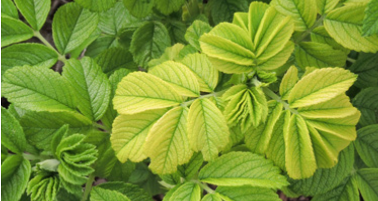
Chlorotische Rosenblätter mit grünen Blattadern durch Fe-Mangel