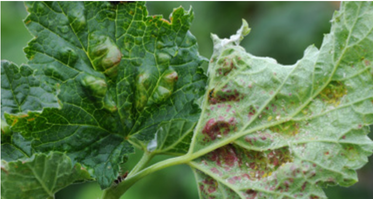
Blasenförmige Auftreibungen der Blätter durch Cryptomyzus ribes