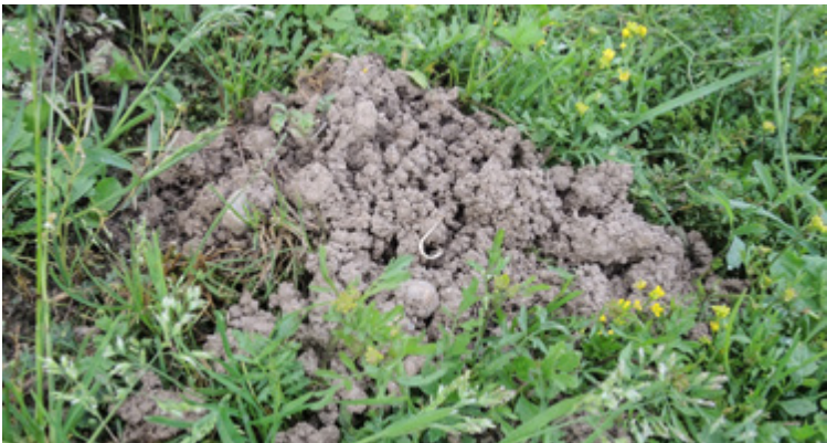
Flach aufgeworfener Erdhügel von Arvicola terrestris in einer Obstwiese