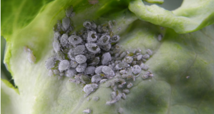
Kolonie von Brevicoryne brassicae auf der Blattunterseite von einem Kohlblatt