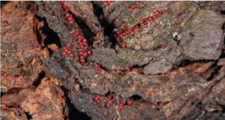
Charakteristische Fruchtkörper (Perithechien) von Nectria galligena an der Rinde