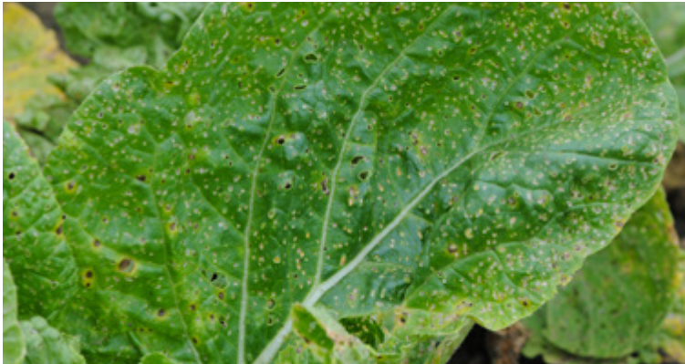
Siebartige Durchlöcherung der Blätter durch die Käfer von Phyllotreta sp.