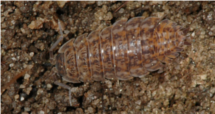
Gegenüber dem Untergrund gut getarnte Mauerassel ( Oniscus asellus )