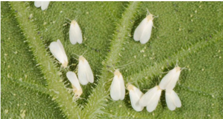
Einzelne Imagines von Trialeurodes vaporariorum auf der Blattunterseite