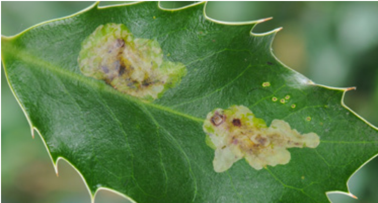
Auffällige Platzminen von Phytomyza ilicis an einem Blatt der Stechpalme