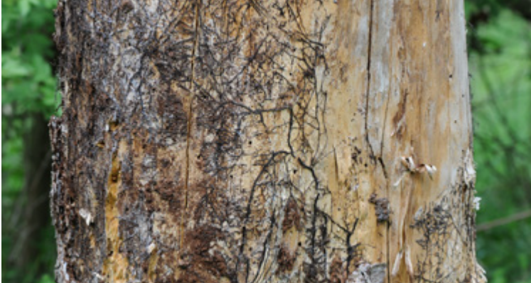
Zahlreiche Rhizomorphen von Armillaria sp. an einem Stamm