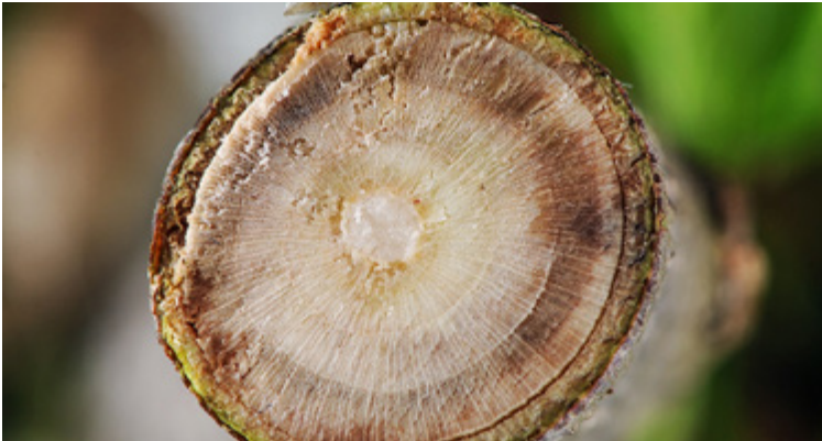
Ringförmige Verfärbungen im Splintholz durch Verticillium dahliae