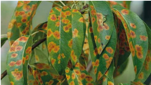
Birneneggerrost ( Gymnosporangium sabinae ) an Birne