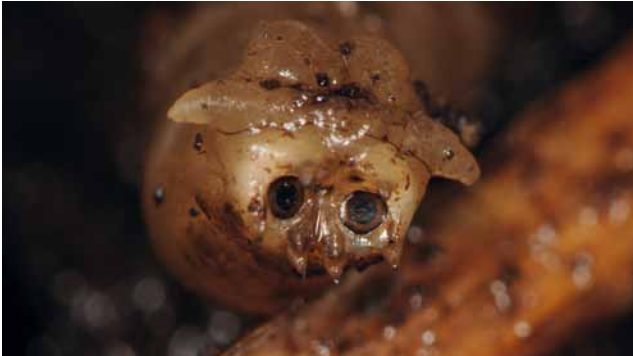
Hinterleib einer Schnakenlarve („Teufelsfratze“)