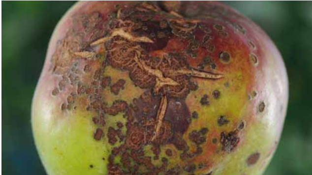
Apfelschorf ( Venturia inaequalis ) an Apfel