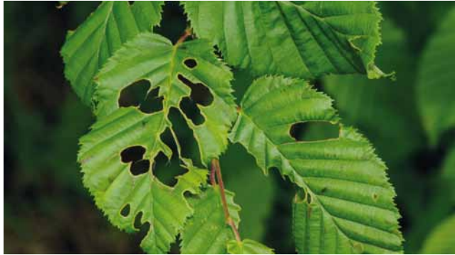
Frostspanner ( Operophtera brumata ) an Hainbuche