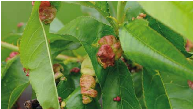
Kräuselkrankheit ( Taphrina deformans ) an Pfirsich