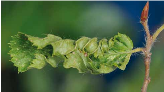
Gallmilben ( Eriophyes macrotrichus ) an Hainbuche