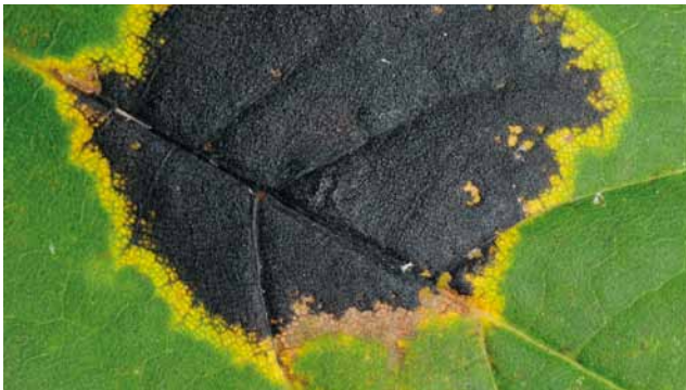
Teerfleckenkrankheit ( Rhytisma acerinum ) an Ahorn