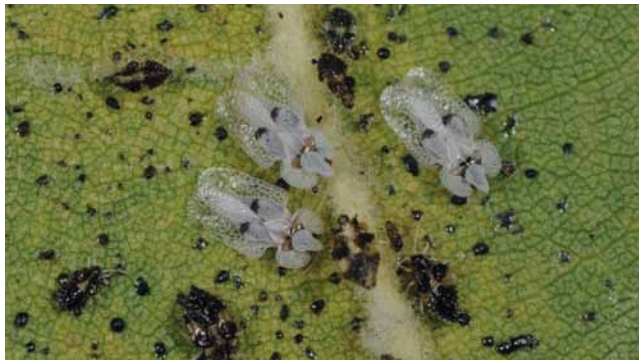
Larven und Imagines der Platanennetzwanze ( Corythuca ciliata )