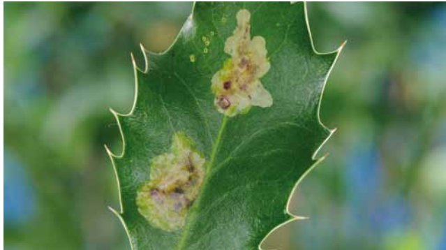
Ilexminierfliege ( Phytomyza ilicis ) an Stechpalme