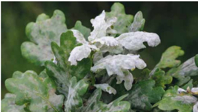
Echter Mehltau ( Microsphaera alphitoides ) an Eiche