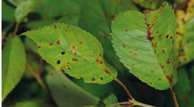
Schrotschusskrankheit ( Stigmia carpophila ) an Kirsche