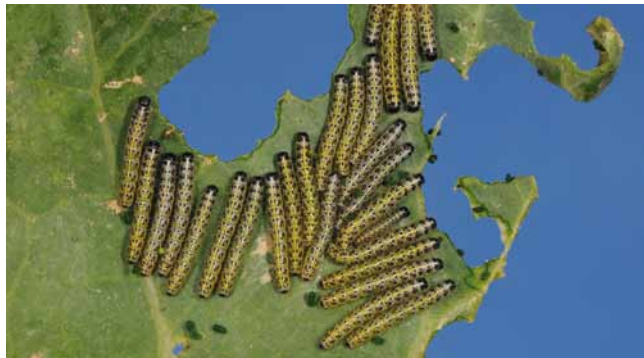
Larven vom Großer Kohlweißling ( Pieris brassicae )