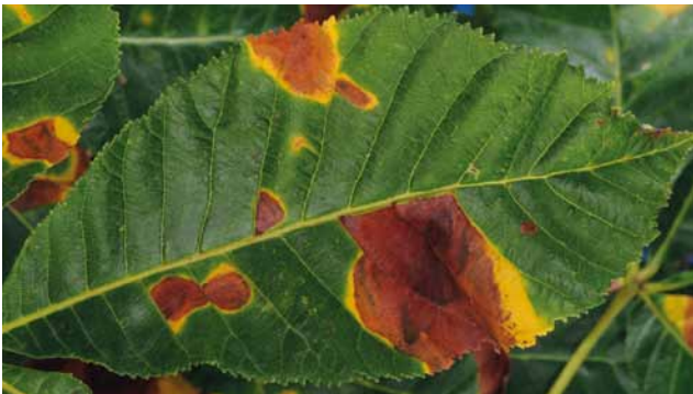
Blattbräune ( Guignardia aesculi ) an Kastanie