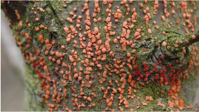
Rotpustel ( Nectria cinnabarina ) an Ahorn