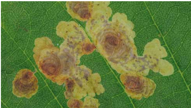
Miniergänge der Kastanienminiermotte ( Cameraria ohridella )