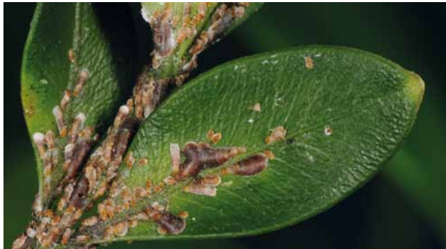
Kommasschildlaus ( Lepidosaphes ulmi ) an Buchsbaum