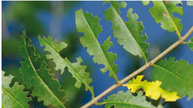
Schadbild der Käfer vom Dickmaulrüssler ( Otiorhynchus sp. ) an Liguster