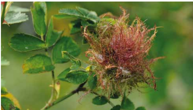
Rosengallwespe ( Diplolepis rosae ) an Rose