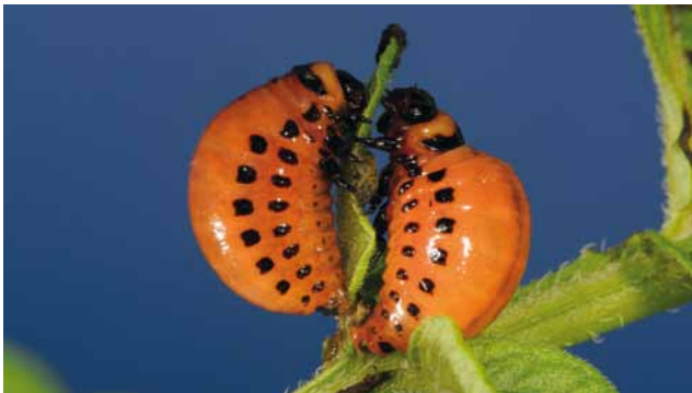
Larven vom Kartoffelkäfer ( Leptinotarsa decemlineata )