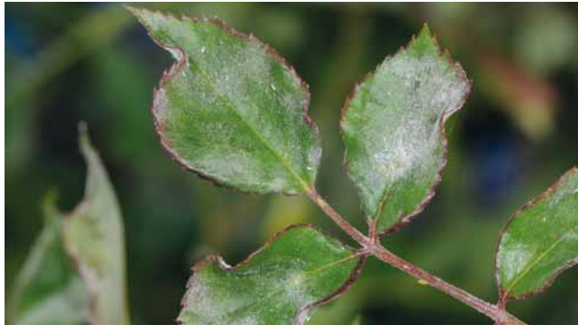
Echter Mehltau ( Sphaerotheca pannosa ) an Rose