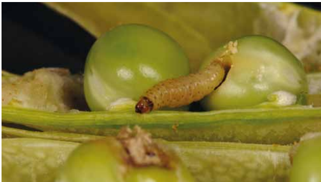
Larve vom Erbsenwickler ( Laspeyresia nigricana )