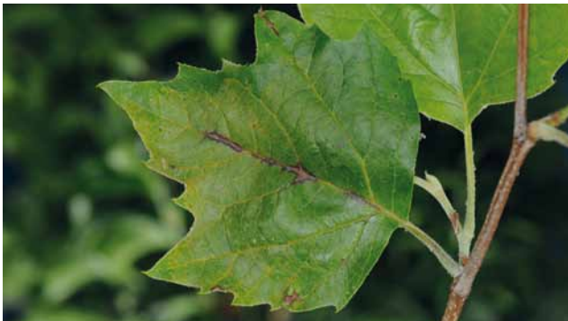
Blattbräune ( Apiognomonía veneta ) an Platane