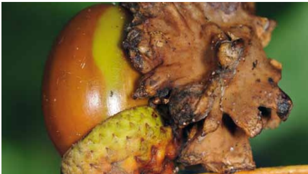
Knopperrgallwespe ( Andricus quercuscalicis ) an Eiche