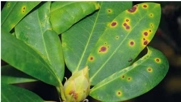
Blattfleckenpilz ( Glomerella cingulata ) an Rhododendron