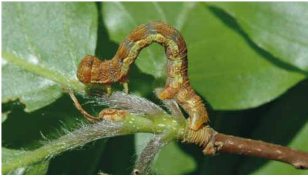
Spanneraube an Buche