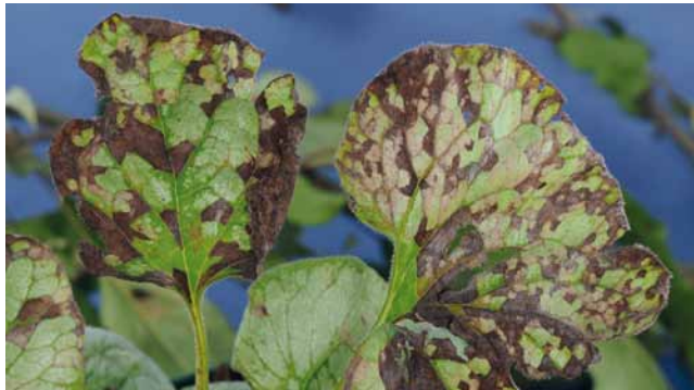
Blattnematoden ( Aphelenchooides sp. ) an Kaukasusvergissmeinnicht