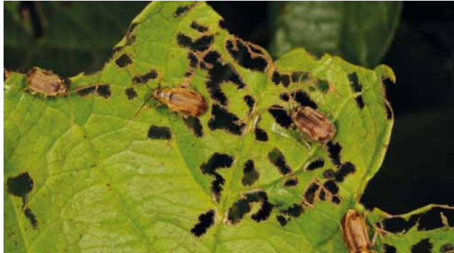
Imagines vom Schneeballblattkäfer ( Pyrrhalta viburni )