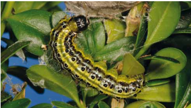
Larve vom Buchsbaumzünsler ( Cydalima perspectalis )