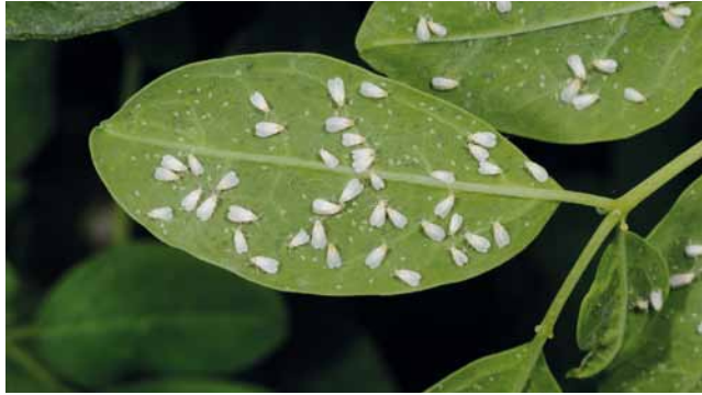
Imagines der Weiße Fliege ( Trialeurodes vaporariorum )