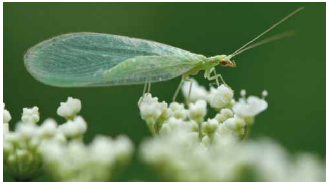
Imago von einer Florfliege ( Chrysoperla carnea )