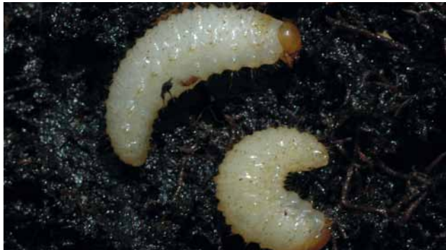
Larven vom Dickmaulrüssler ( Otiorynchus sp. )