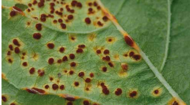
Malvenrost ( Puccinia malvacearum ) an Malve