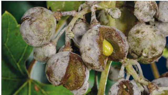
Echter Mehltau ( Ucinula necator ) an Wein