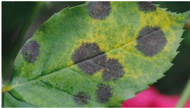
Sternrußtau ( Diplocarpon rosae ) an Rose