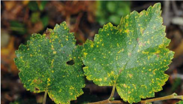
Birkenrost ( Melampsorium betulinum )