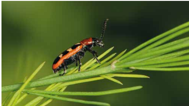
Imago vom Spargelhähnchen ( Crioceris asparagi )