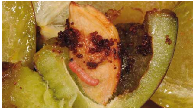
Larve vom Pflaumenwickler ( Cydia funebrana )