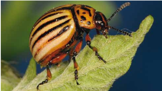
Imago vom Kartoffelkäfer ( Leptinotarsa decemlineata )