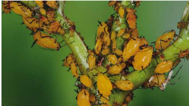
Oleanderblattlaus ( Aphis nerii ) an Dipladenia