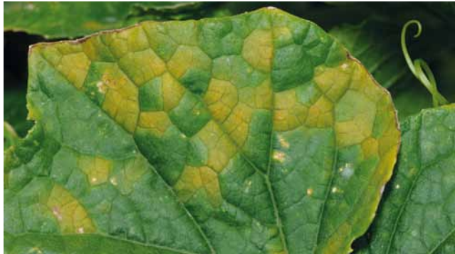
Falscher Mehltau ( Pseudoperonospora cubensis ) an Melone